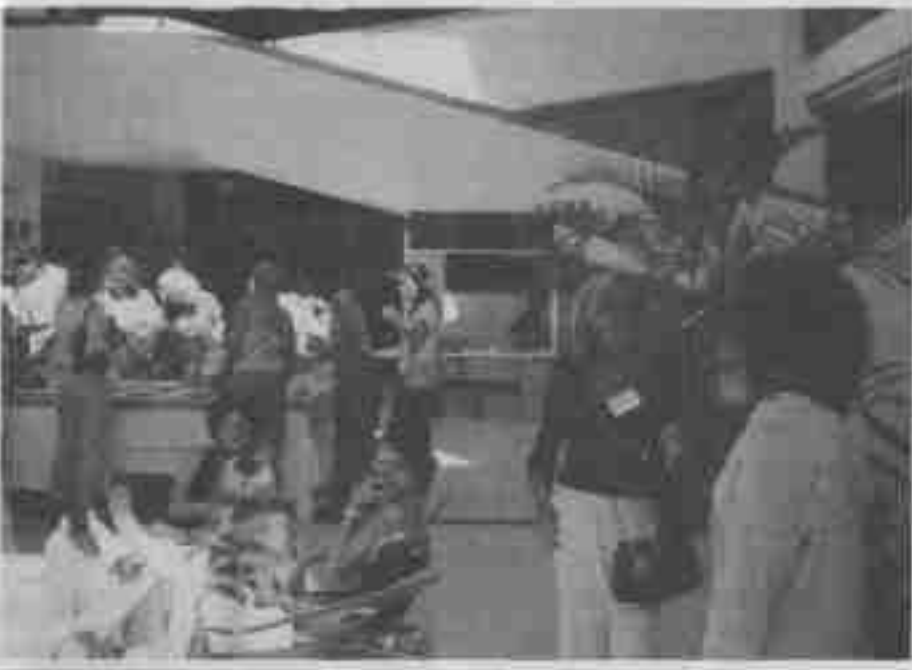
MOMENTOS DE DESCANSO.