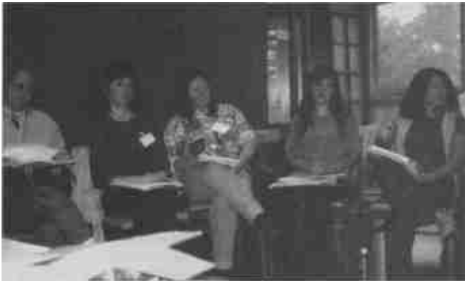
MOMENTOS DE LAS MESAS DE TRABAJO

\ \ ...Nuestro compromiso como personas es mejorar nuestras vidas, nuestras conductas, para que nuestra descendencia también sea mejor, ya que todos somos espejos del otro.