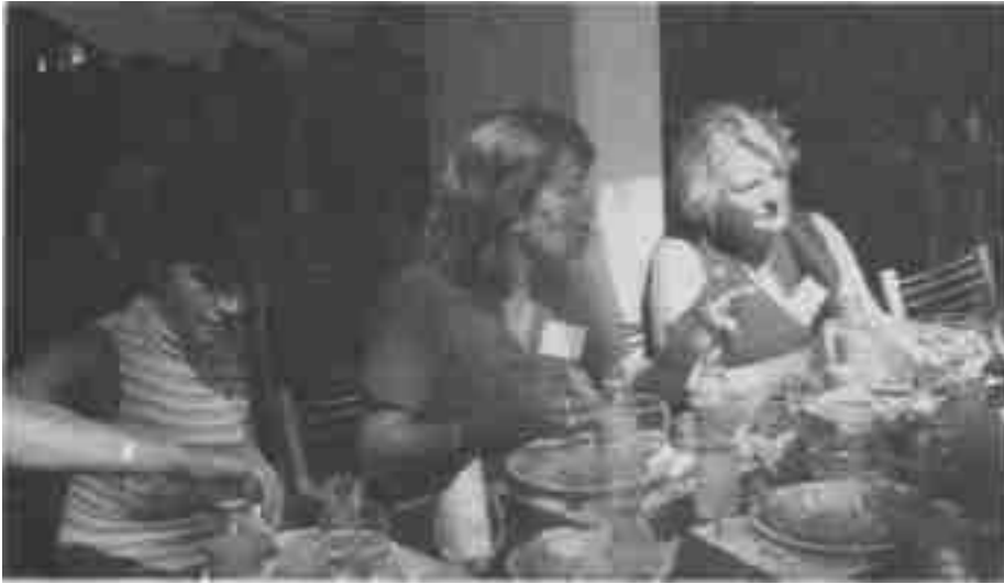
ALMORZANDO ENTRE AMIGAS.