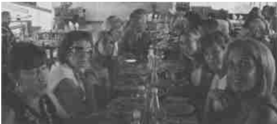
ALMUERZO ENTRE AMIGAS