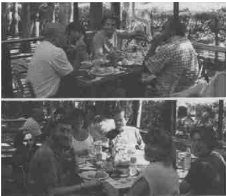
COMPARTIENDO MOMENTOS DE DESCANSO.

Como profesionales de la ayuda psicológica formados desde el E.C.P., considero indispensable explorar y revatorizar el cruce filosófico, científico y metodológico entre Rogers y Gendlin. Esto hizo posible desarrollar, a partir de "cómo el consultante y el terapeuta se relacionan con la experiencia", un nivel profundo, físicamente sentido, de conexión con la experiencia implícita de la persona como fuente de información, transformación, de dirección y autoridad.