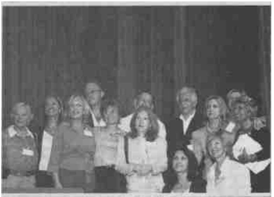
CONFERENCISTAS INVITADOS, ALGUNOS DE LOS DIRECTIVOS DE LOS INSTITUTOS PARTICIPANTES Y MIEMBROS DE LA COMISIÓN DIRECTIVA.