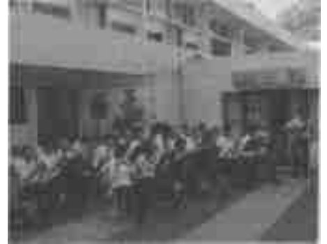
DÍA DE APERTURA DEL FORO. RECEPCIÓN CON ORQUESTA.