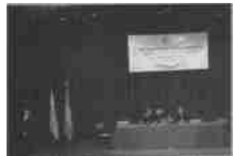
II CONGRESO DE COUNSEUNG/ 2003

Aún hay mucho por hacer, hay muchos proyectos a concretar. Los necesitamos en la AAC, la casa de todos.//////Los esperamos////////